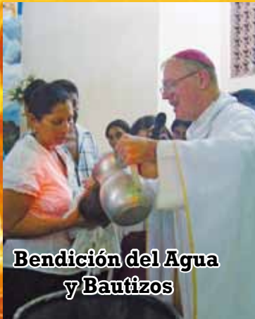
Bendición del Agua y Bautizos