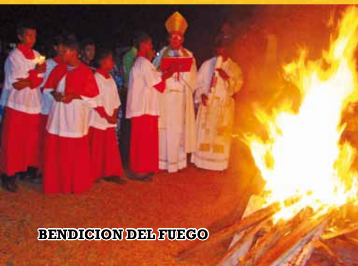
BENDICION DEL FUEGO