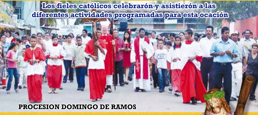
PROCESION DOMINGO DE RAMOS

Los fieles católicos celebraron y asistieron a las diferentes actividades programadas para esta ocasión